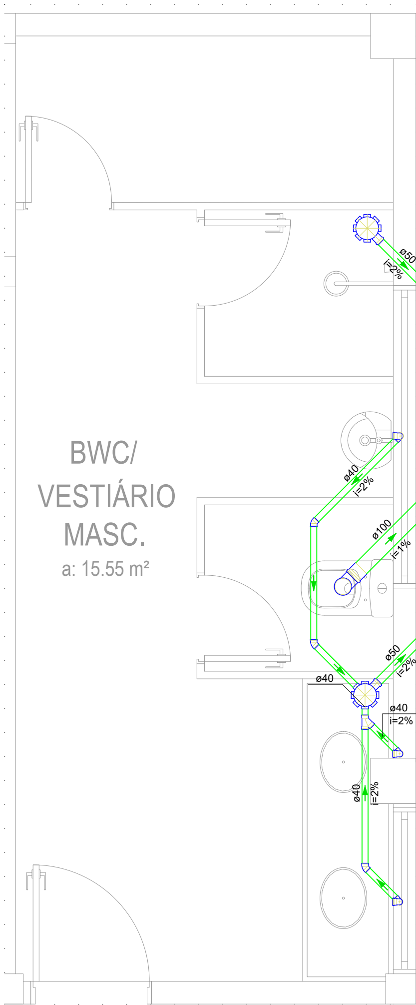
DETALHE S4 PROJETO HIDROSSANITÁRIO ESGOTO ESCALA: 1/25