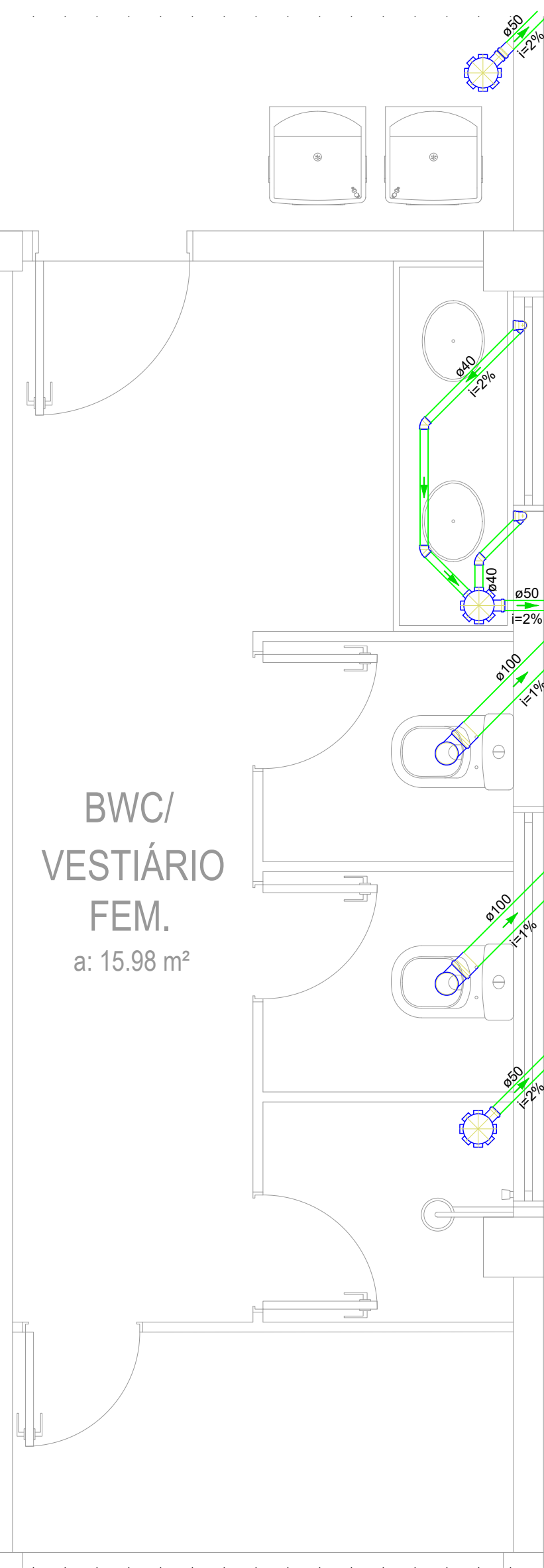
DETALHE S5 PROJETO HIDROSSANITÁRIO ESGOTO ESCALA: 1/25

É PROIBIDA A REPRODUÇÃO DESTES PROJETO, SEM A AUTORIZAÇÃO DO AUTOR LEIS Nº 5194 DE 24/12/1966 E Nº 9610 DE 19/02/98